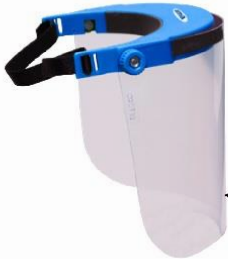
Visera de polycarbonato